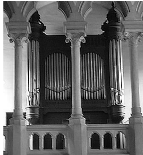
Het orgel in de Chapelle de L'institution du Saint-Sacrement te Autun.

We mogen aannemen dat het orgel na de verhuurperiode te Neuilly-sur-Seine enige tijd in de toonzaal van Cavaillé-Coll heeft gestaan.